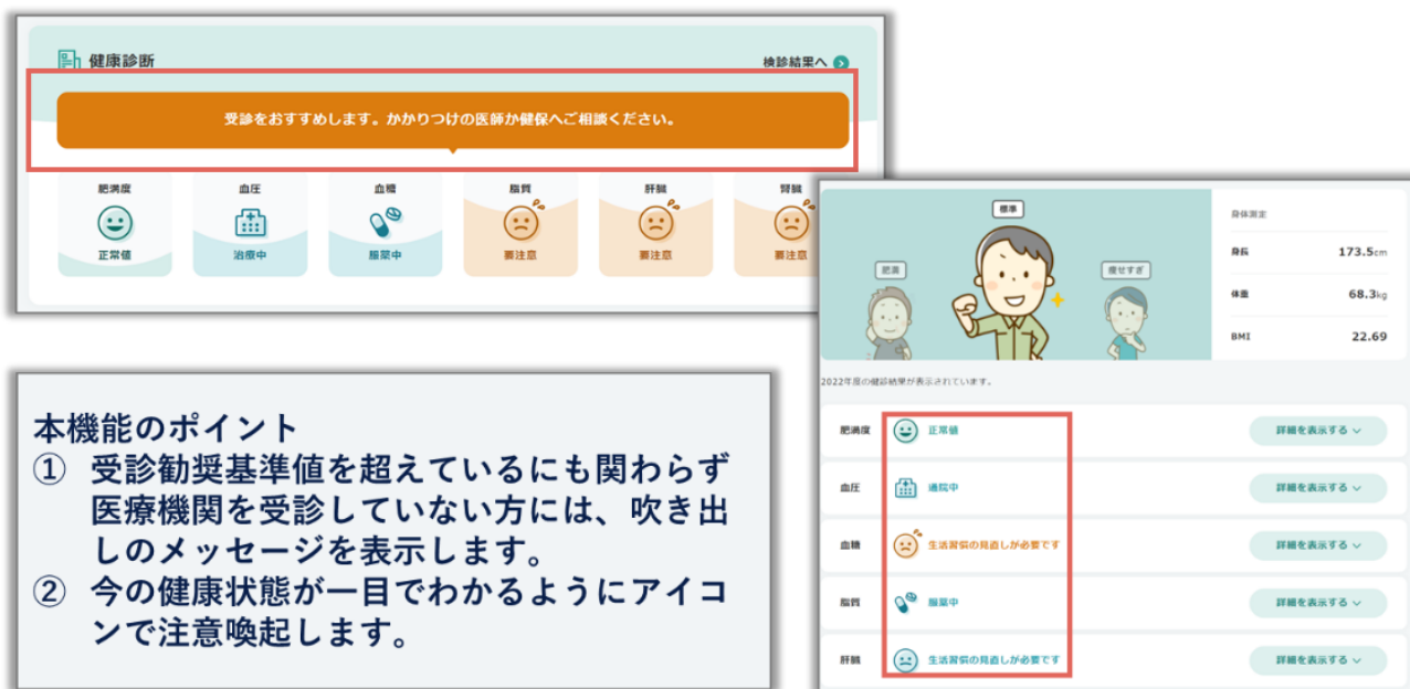
※画面・メッセージは開発サンプルにつき、一部変更となる可能性があります。

また、保険者様独自の基準値に合わせて、該当する加入者様へ個別の「お知らせ」をすることも可能となり、積極的な加入者アプローチを実現いたします。併せて「お知らせ」や対象者の「啓発画面の閲覧有無」その後の「通院の有無」による効果測定機能まで実装いたします。